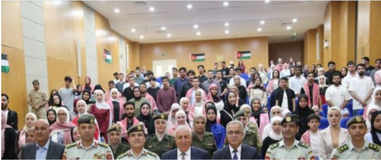
منشور مديرية التربية والتعليم والثقافة العسكرية

وشهدت المحاضرة تفاعلاً من الطلبة من خلال الأسئلة والمداخلات التي تناولت أبرز التحديات الفكرية والأمنية الحديثة، وسبل تعزيز الوعي الوطني والفكري لدى الشباب الجامعي، بما يسهم في إعداد جيل واع قادر على مواجهة مختلف التحديات